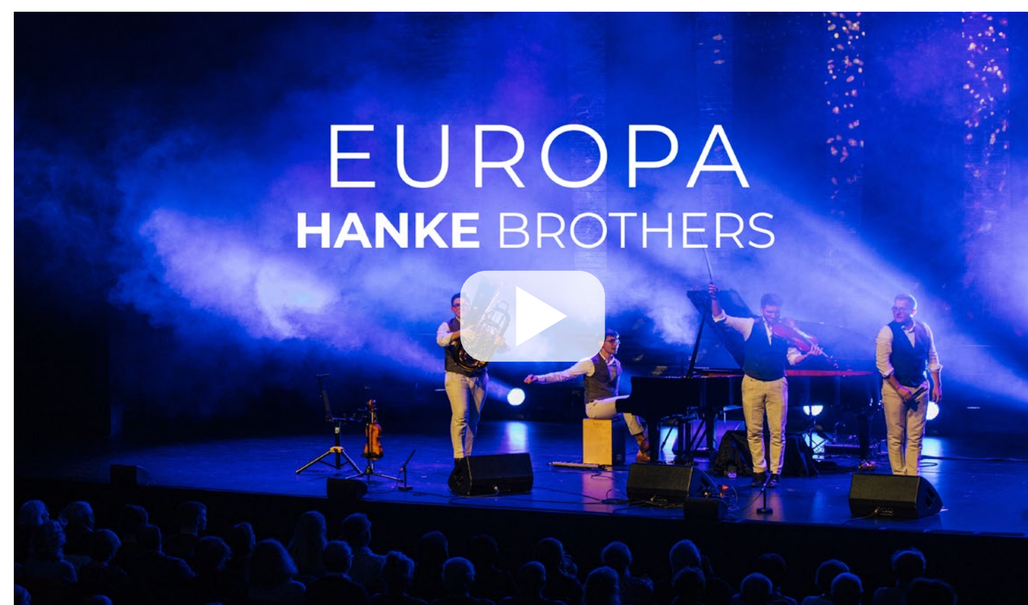
Aleksey Igudesman - Europa 7 Continents - live Mitschnitt Theaterhaus Stuttgart