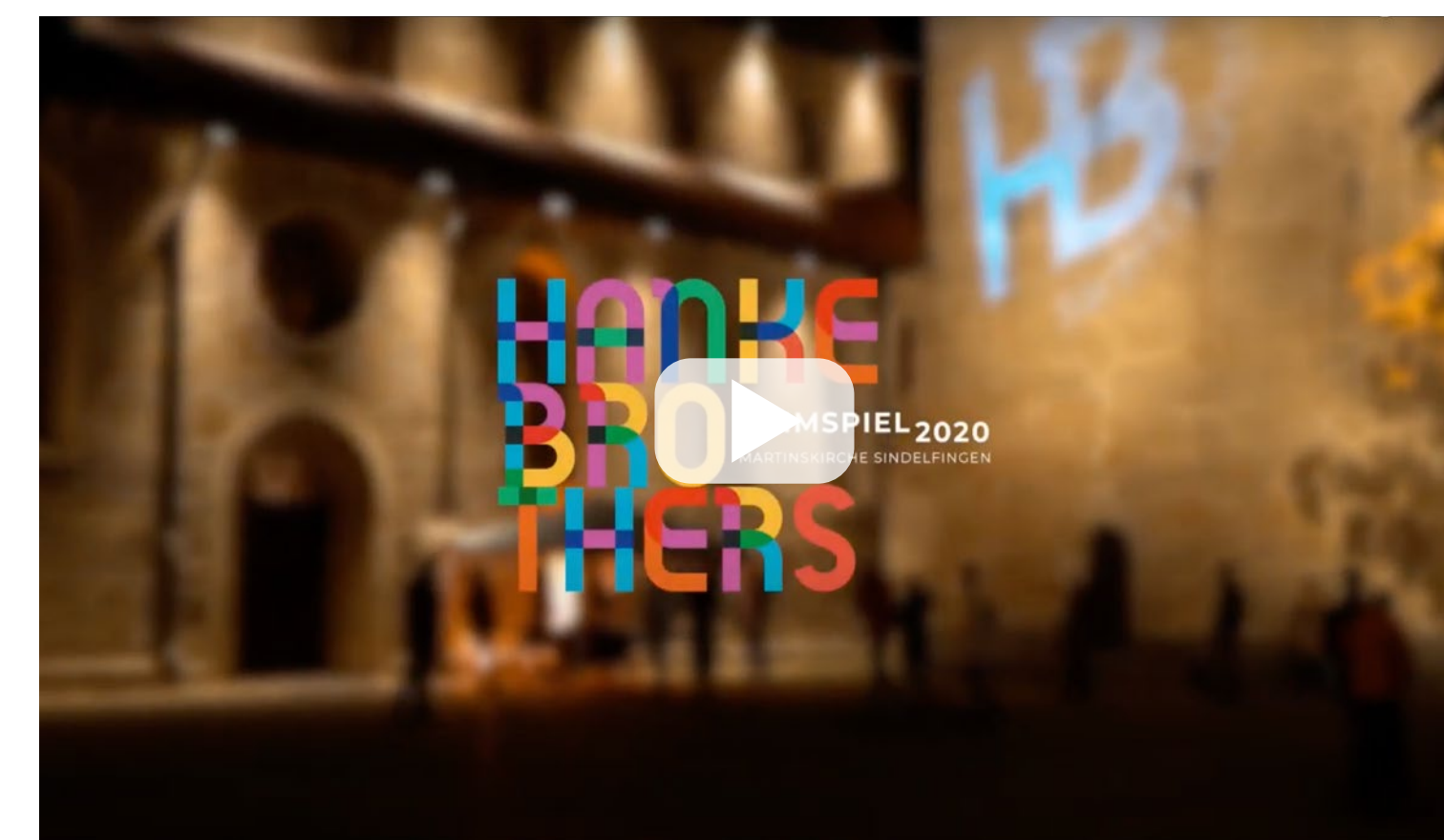
Rückblick HEIMSPIEL 2020