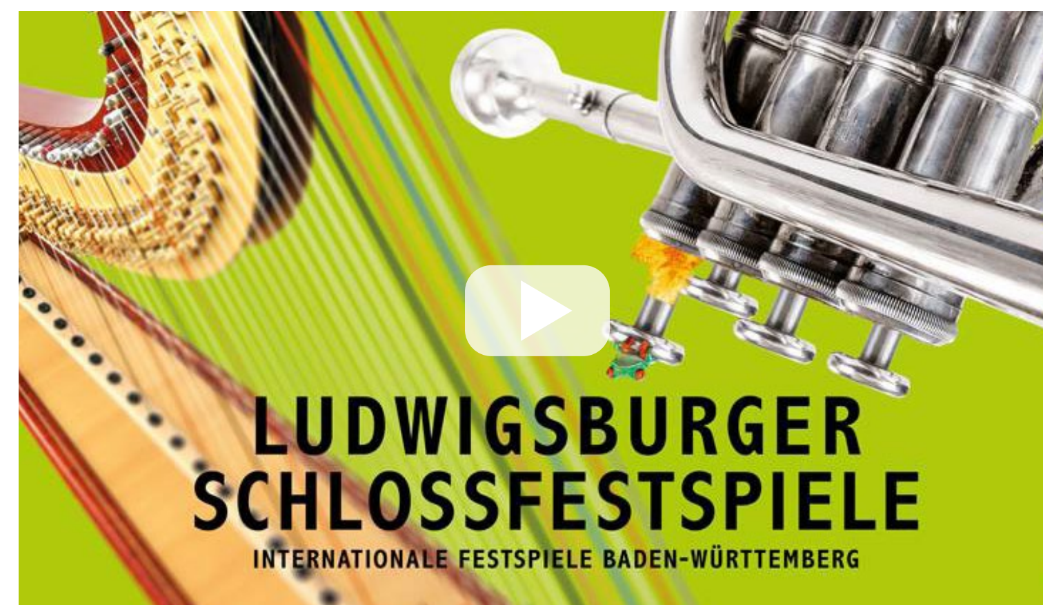
Konzert Ludwigsburger Schlossfestspiele Dokumentation von Ernst & Young